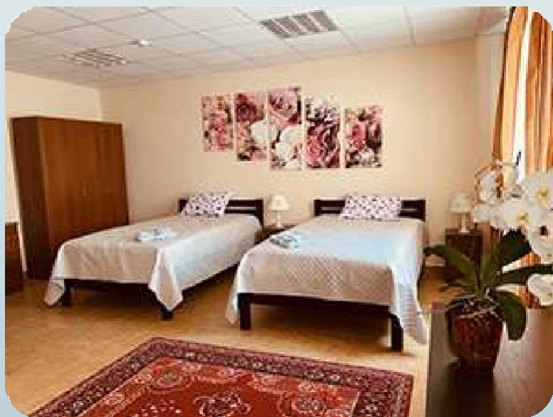
Лабораторія з організації готельного обслуговування

Кафедри харчових технологій, готельно-ресторанного і туристичного сервісу